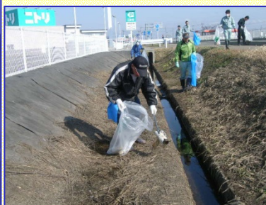
道路だけでなくこんなところまでゴミがありました。