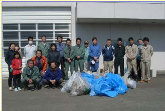
みんなで記念撮影。お疲れ様でした！ ありがとうございました。