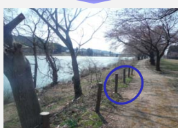
基礎部分から規制柵を復旧。