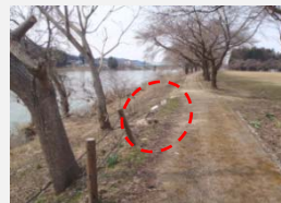
河岸のフットパスの規制柵が基礎から倒れていた。