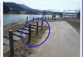
基礎部分から規制柵を復旧。