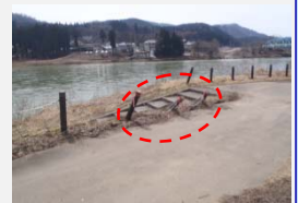
船着場の規制柵が基礎から倒れていた。