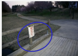
L型のアンクルを取り付け補強するとともに、注意看板を設置。