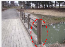
渡り橋の手すりが腐食し、折れる危険性があった。