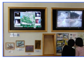
「情報提供施設の様子」