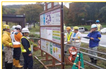
現場事務所の点検のようす