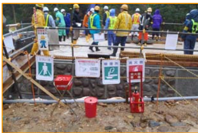
砂防堰堤工事の現場をパトロール