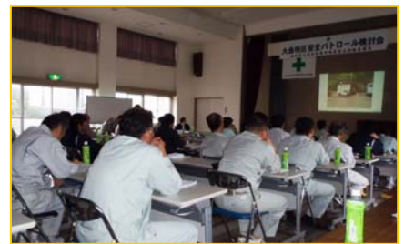
全体討議のようす