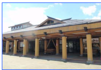
「道の駅雁の里せんなん」