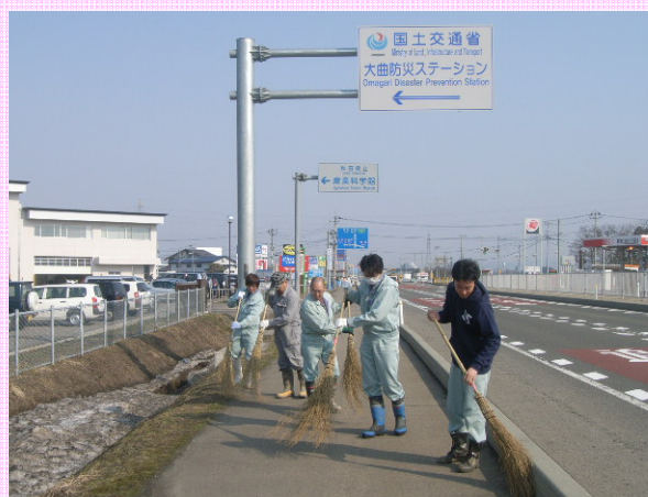
ほうきでさっささ