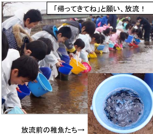
放流前の稚魚たち→