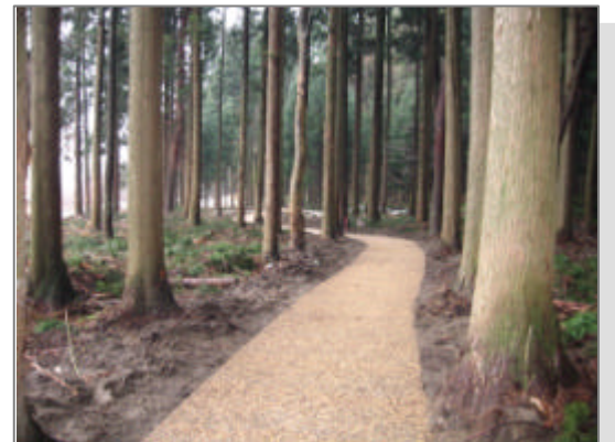
去年完成した杉並木の散策路