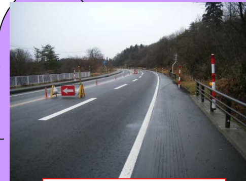
雪が降る前の封鎖状況