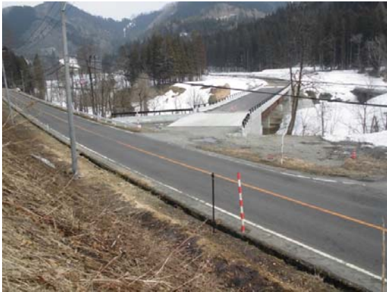
①上院内交差点箇所