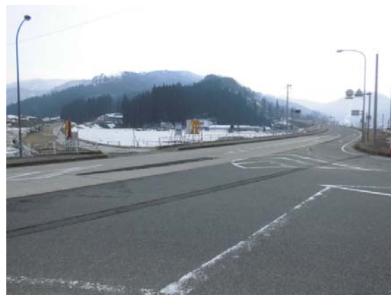
②下院内交差点箇所