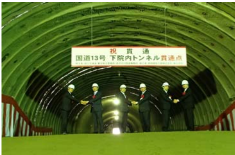
最後に記念撮影を行いました。