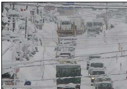
▲ 幅員が狭い道路 (H26.01.14金沢中野地区)