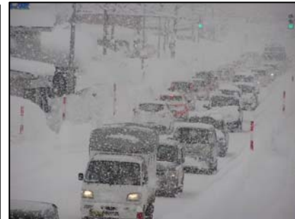
▲ 吹雪による渋滞 (H26.01.14金沢中野地区)