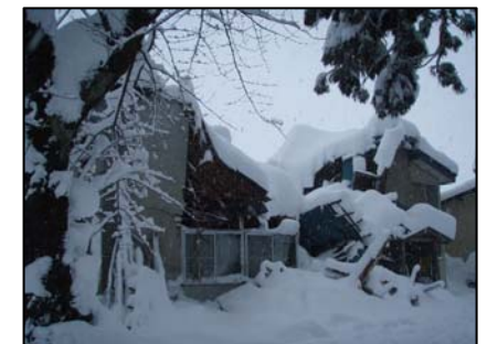
▲ 倒壊した家屋(横手市)