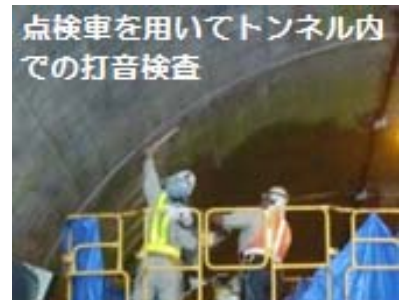
米沢国道維持出張所では、トンネル点検車によるコンクリートの打音検査や、冬期には除雪グレーダーなどの除雪機械による除雪作業など、国道の維持管理を行っています。作業の際には通行規制等を伴う場合がありますので、ご理解とご協力をお願い致します。