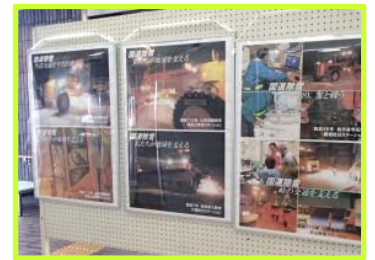
▲ 道路施設の老朽化対策と国道除雪に関するパネル展示。普段見れない現場の写真をたくさんの方にご覧頂きました。

あいにくの雨模様に関わらず、 180 名のお客様に搭乗頂きました…ありがとうございました!!