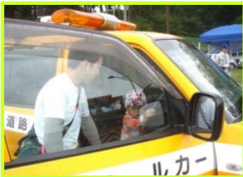
▲ 除雪グレーダー(上) & 道路パトロールカー(下)乗車体験は、お子様連れに大人気でした。