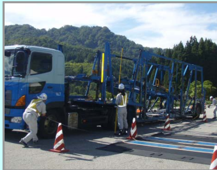
※写真の車両と違反車両は関係ありません。

車体の高さ、幅、長さ、最遠軸距を測定しました。今回の取締りでは、許可値に違反している車両はありませんでした。