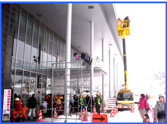
たくさんの方が並んでくれました