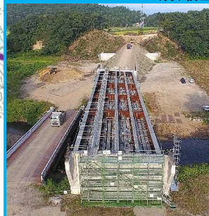
升形2号橋下部工工事 (株)新庄・鈴木・柴田組

升形川に架かる升形3号橋の床版と升形2号橋の下部工の工事を行っております。現在、床版工はコンクリート打設に向けて型枠・鉄筋組立中です。下部工は橋台の基礎の工事中です。今年度中の完成に向けて工事を進めています。