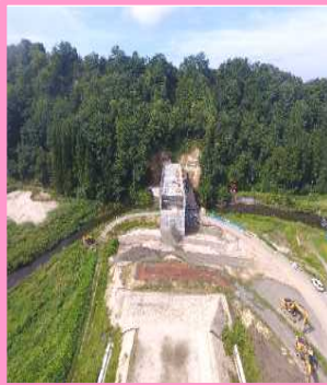
升形地区道路改良工事 (株)新庄・鈴木・柴田組

升形川に架かる升形4号橋の床版工とその周辺の盛土・擁壁を行う工事です。現在、床版工は概ね完了し、盛土と擁壁の工事を行っております。今後も引き続き盛土と擁壁の工事を進めていきます。