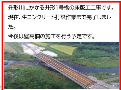
谷地道路改良工事 丸充建設(株)

升形川に架かる升形2号橋の鋼桁を架ける工事です。現在は愛知県の工場では鋼桁を製作中です。鋼桁の架設は令和2年5月頃を予定しています。