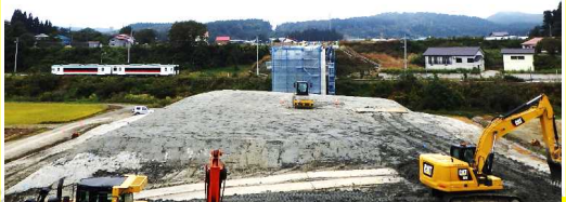
津谷道路改良工事 沼田建設(株)

岩花地区、津谷地区(JR陸羽西線付近)及び前波地区の切土・盛土、排水構造物を行う工事です。工事は6割程度まで完了しました。今後も引き続き、残りの土工事と排水構造物を進めていきます。