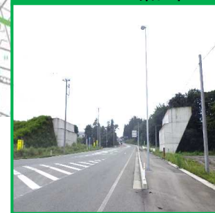
升形IC橋外上部工工事 東日本コンクリート(株)

国道458号をまたぐ橋梁のコンクリート桁を架ける工事です。現在は宮城県の工場ではコンクリート桁を製作中です。11月下旬からコンクリート桁の架設を行う予定です。