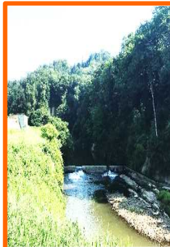
升形2号橋上部工工事 龍上工業(株)

升形川に架かる升形4号橋の床版工とその周辺の盛土・擁壁を行う工事です。現在、床版工は概ね完了し、盛土と擁壁の工事を行っております。今後も引き続き盛土と擁壁の工事を進めていきます。