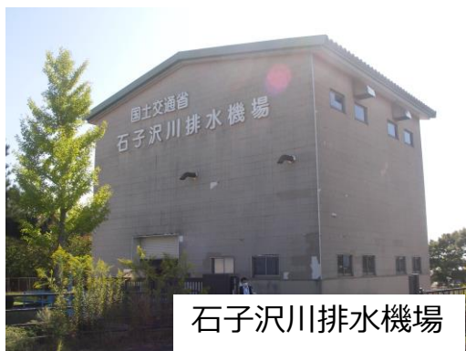
石子沢川排水機場

排水機場とは、大雨による水害を軽減するために排水ポンプを運転して雨水を川に排出するための施設です。 寒河江出張所管内には、大旦川排水機場・新田川排水機場・渋川排水機場・荷口川排水機場・沼川排水機場・石子沢川排水機場の6箇所の排水機場があります。