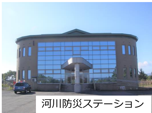
河川防災ステーション

中山町にある「河川防災ステーション（東村山地区）」は、緊急時に備えて、水防活動で使用する土砂やブロックなどが大量に蓄えられています。洪水時には、水防資材の供給、復旧活動の基地として利用されますが、普段は、地域の人々による河川を中心とした文化活動や広報活動の拠点として、また、レクリエーションの場として活用されています。