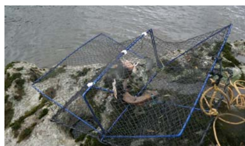
秋の最上川風物詩 モクズガニ漁です！

※寒河江出張所では地域のみなさまが安心して暮らせるよう、日々巡視及び維持管理を行っていますが、お気づきの点がございましたら下記までお問合せ下さい。