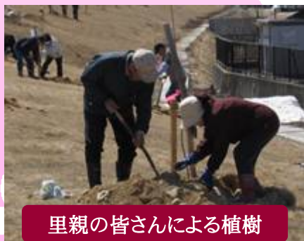
里親の皆さんによる植樹