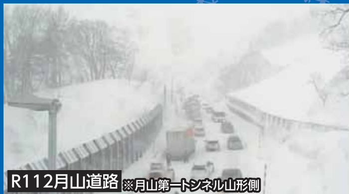
R112月山道路 ※月山第一トンネル山形側