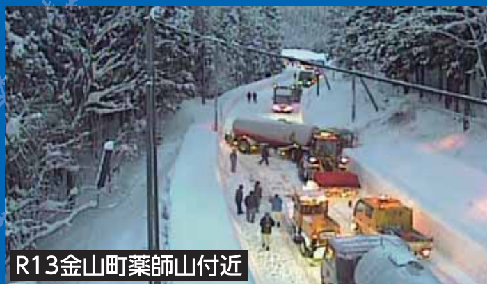
R13金山町薬師山付近