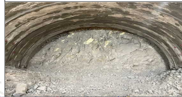
金山第一トンネル(切羽写真)