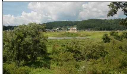
荒屋地区 (湯沢方向)