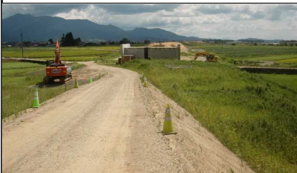
萩野地区 (尾花沢方向)