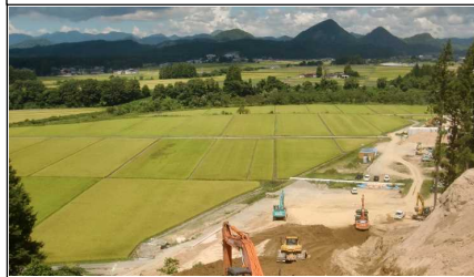
上台地区 (湯沢方向)