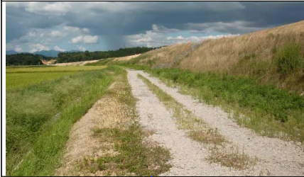
萩野地区 (湯沢方向)