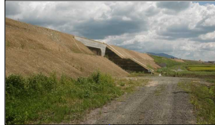
萩野地区 (尾花沢方向)