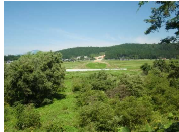
荒屋地区(湯沢方向)