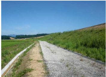
萩野地区(湯沢方向)