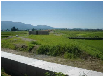
萩野地区(尾花沢方向)