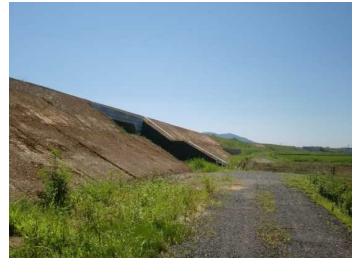
萩野地区(尾花沢方向)