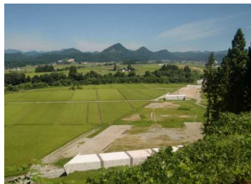
上台地区(湯沢方向)