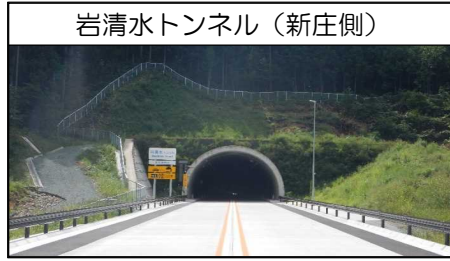
岩清水トンネル (新庄側)