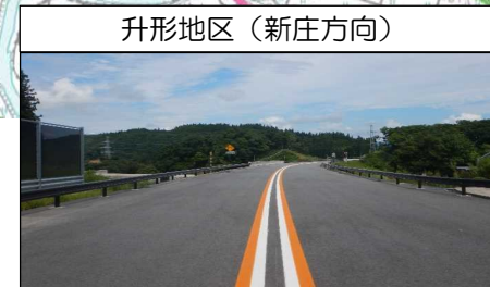
升形地区 (新庄方向)