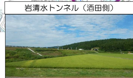
岩清水トンネル (酒田側)