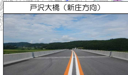
戸沢大橋 (新庄方向)