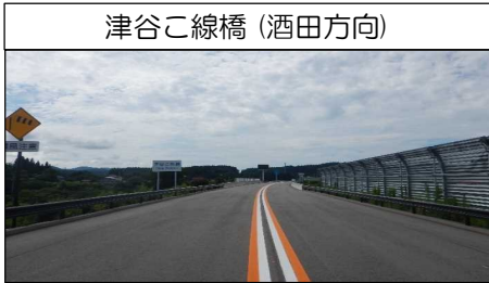
津谷こ線橋 (酒田方向)