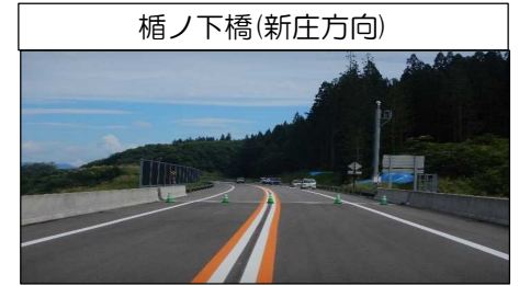
楯ノ下橋(新庄方向)