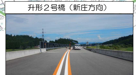
升形2号橋 (新庄方向)