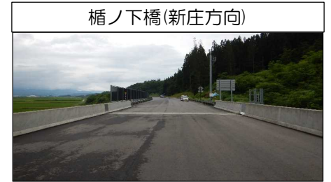
楯ノ下橋(新庄方向)