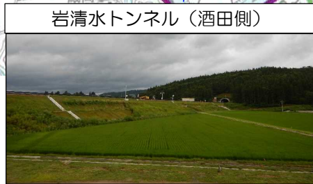
岩清水トンネル (酒田側)