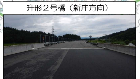
升形2号橋 (新庄方向)