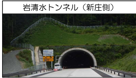
岩清水トンネル (新庄側)