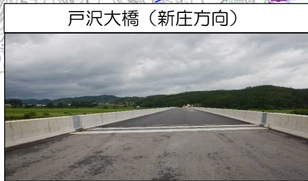
戸沢大橋 (新庄方向)