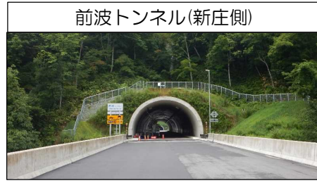
前波トンネル(新庄側)