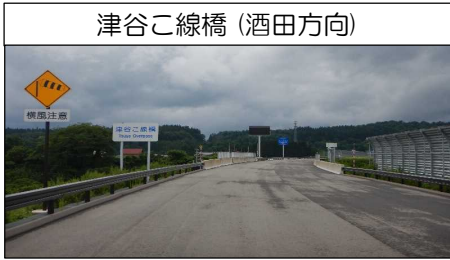
津谷こ線橋 (酒田方向)