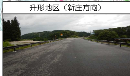
升形地区 (新庄方向)