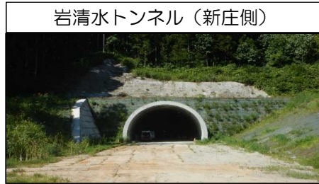
岩清水トンネル (新庄側)