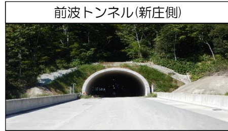
前波トンネル(新庄側)