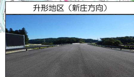
升形地区 (新庄方向)