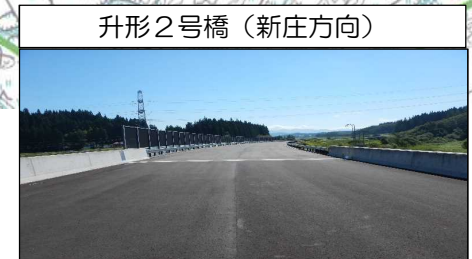
升形2号橋 (新庄方向)