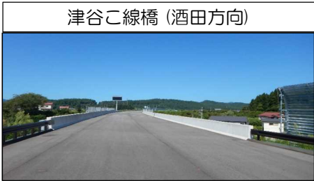
津谷こ線橋 (酒田方向)