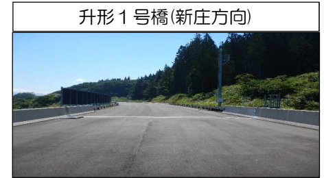
升形1号橋(新庄方向)