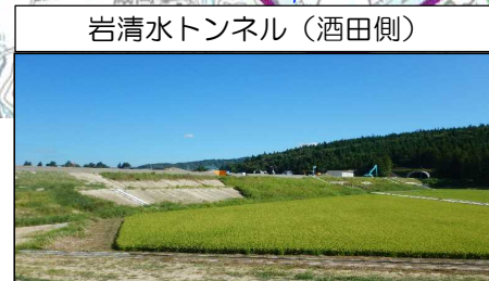
岩清水トンネル (酒田側)