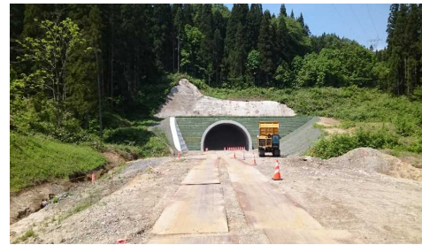
岩清水トンネル(新庄側)