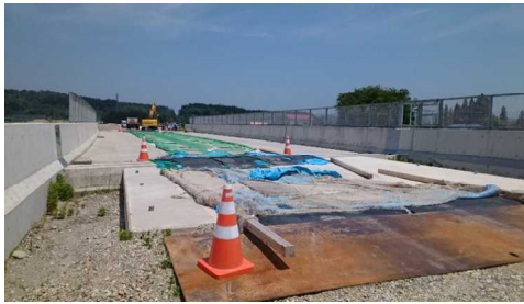
津谷こ線橋(酒田方向)