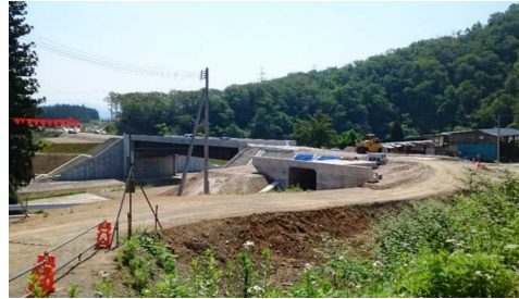
升形地区(新庄方向)