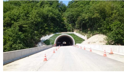
前波トンネル(新庄側)