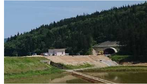
岩清水トンネル(酒田側)