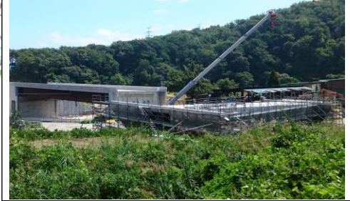
升形地区(新庄方面)