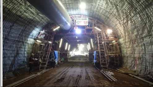
岩清水トンネル(新庄方面)