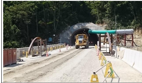
前波トンネル(酒田方面)