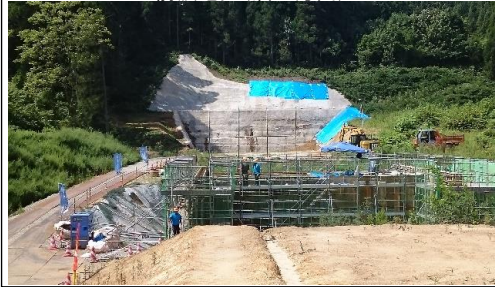
前波地区(酒田方面)