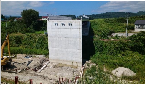
津谷こ線橋(酒田方面)