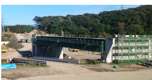
升形3号橋(新庄方面)