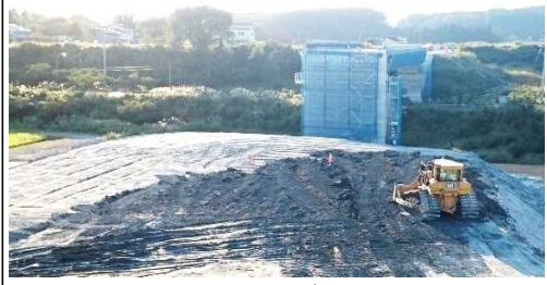
津谷跨線橋付近(酒田方面)