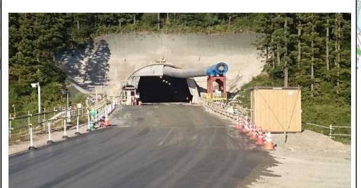
岩清水地区(新庄方面)