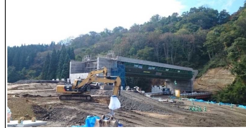
升形4号橋(酒田方面)