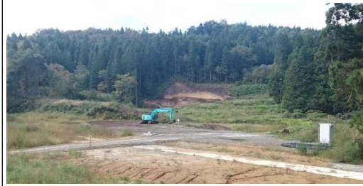
前波地区(酒田方面)