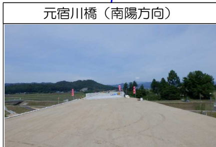
元宿川橋(南陽方向)