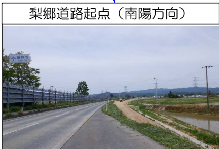
梨郷道路起点(南陽方向)