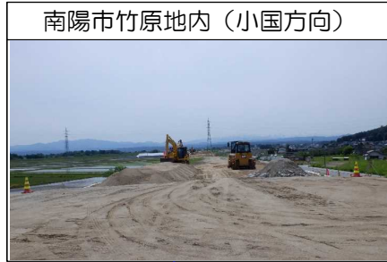
南陽市竹原地内(小国方向)