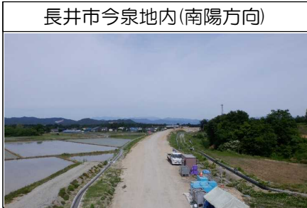
長井市今泉地内(南陽方向)