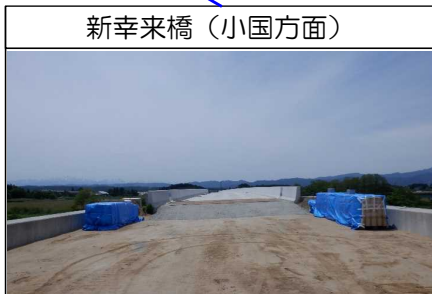
新幸来橋(小国方面)