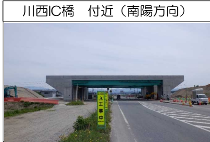
川西IC橋 付近(南陽方向)