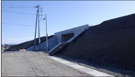
川西町西大塚 地内(高畠方向)