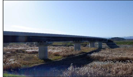
新幸来橋(小国方向)