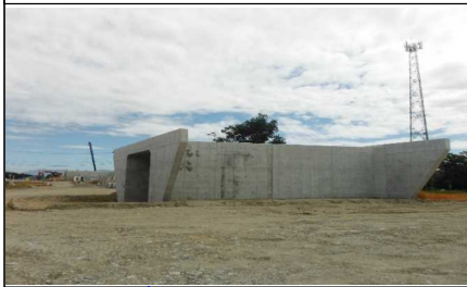
川西町西大塚 地内(高畠方向)