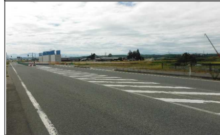
川西町西大塚 地内(小国方向)