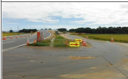
川西町西大塚 地内