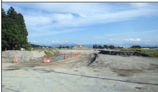
川西町西大塚 地内