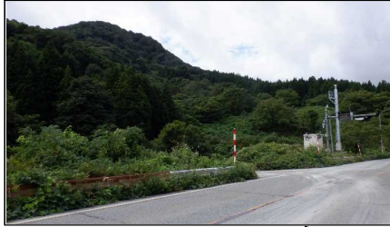
小国トンネル 終点側