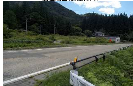
及位地区(新庄方向)