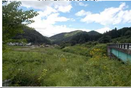
及位地区(横手方向)