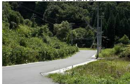
及位地区(町道付替)