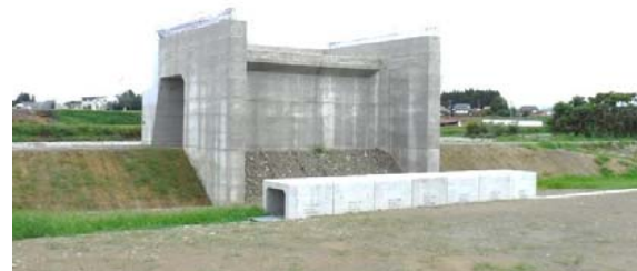
泉田川橋 (金山方面)