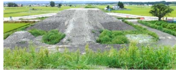
十日町(谷地小屋東)地区 (新庄方面)