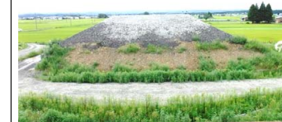
十日町(谷地小屋南)地区 (新庄方面)