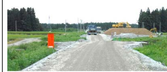
十日町(中川原)地区 (金山方面)