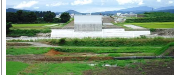
泉田川橋 (新庄方面)