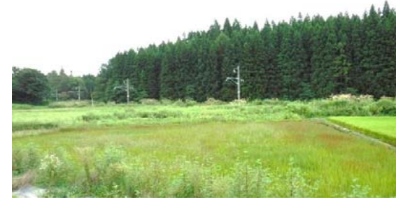
(主)新庄鮭川戸沢線交差部 (新庄方面)