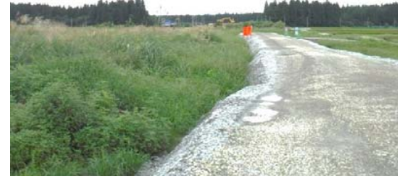
十日町(谷地小屋東)地区 (金山方面)