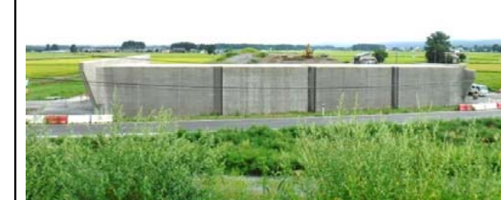
十日町(下谷地小屋)地区 (金山方面)