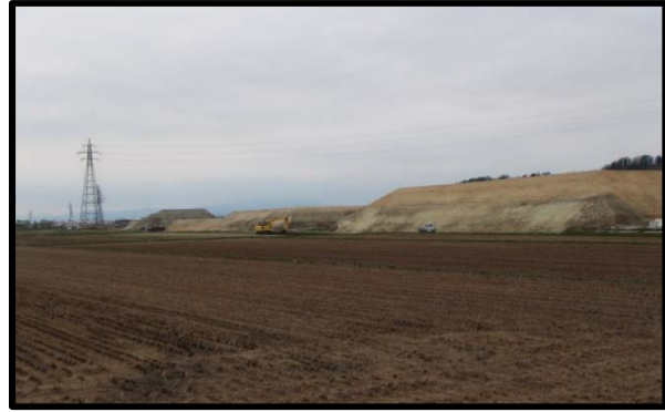
西郷地区(山形方向)