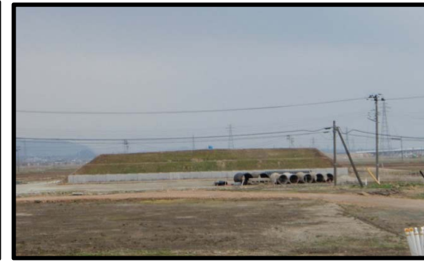
浮沼地区 (山形方向)