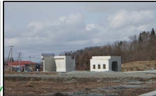
村山北(1)IC橋 (新庄方向)