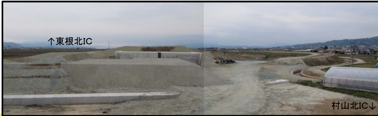
村山IC(仮称) (山形方向)