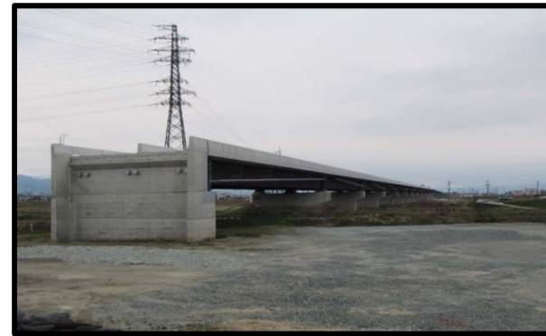
西郷高架橋A2側(山形方向)