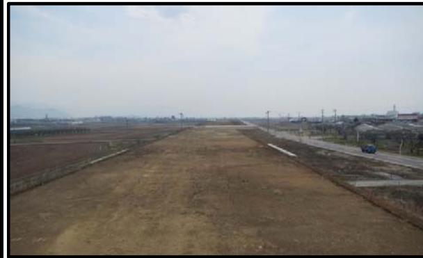
野田地区(山形方向)