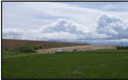
東根北IC(仮称)(山形方向)