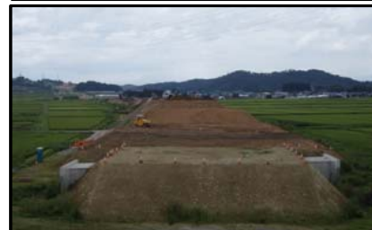
西郷地区(新庄方向)