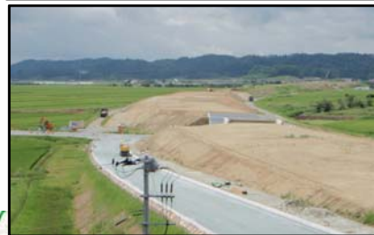
大石田村山IC(山形方向)