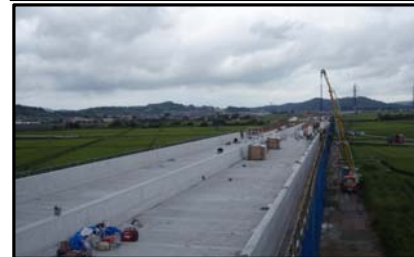
西郷高架橋A2側(新庄方向)