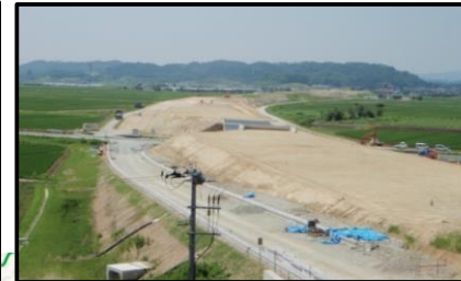
大石田村山IC(山形方向)