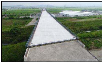
西郷高架橋A1側(新庄方向)