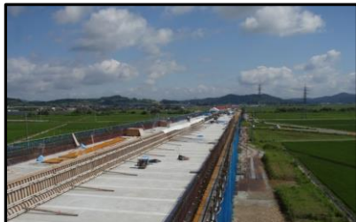
西郷高架橋A2側(新庄方向)