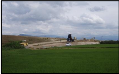
東根北IC(仮称)(山形方向)