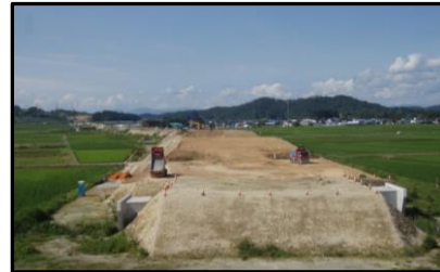
西郷地区(新庄方向)