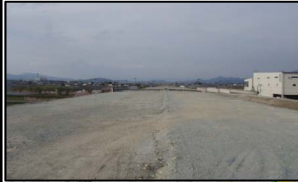
羽入地区(新庄方向)