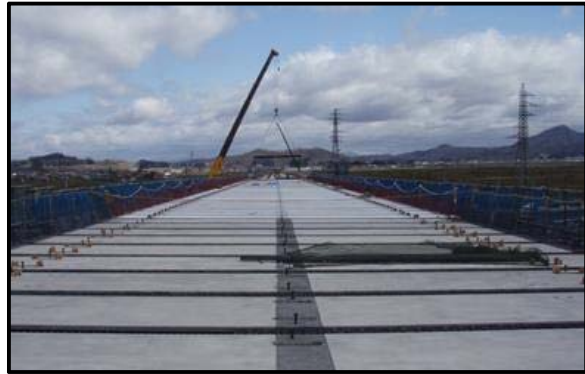
西郷高架橋A2側(新庄方向)