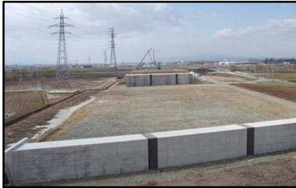
西郷地区(山形方向)