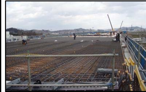
西郷高架橋A1側(新庄方向)