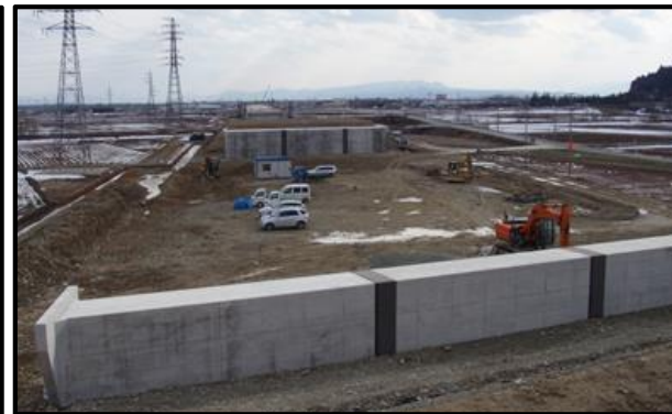
西郷地区(山形方向)