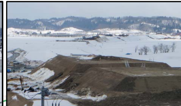
大石田村山IC(山形方向)