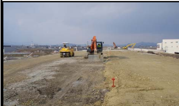
羽入地区(新庄方向)