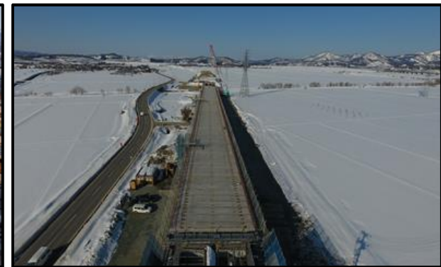
西郷高架橋A2側(新庄方向)