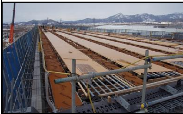
西郷高架橋A1側(新庄方向)