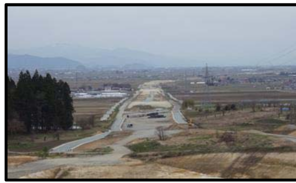
名取地区(山形方向)