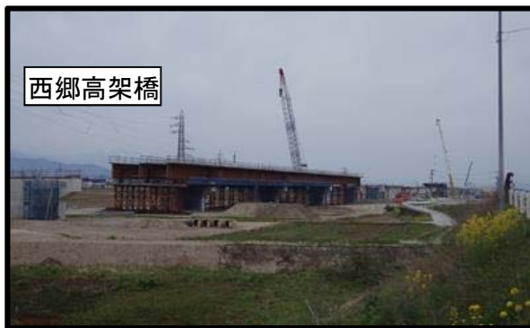
西郷地区(山形方向)