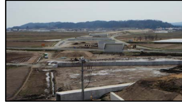
村山大石田IC(仮称)(山形方向)