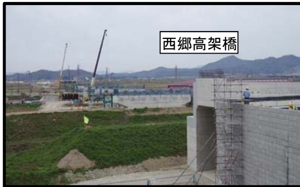
西郷高架橋(仮称)(新庄方向)