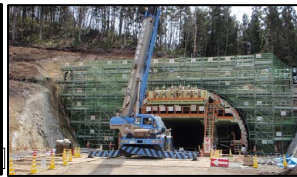
村山トンネル(終点側坑口)