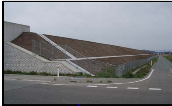
野田地区(新庄方向)