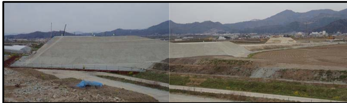
村山IC(仮称)(新庄方向)