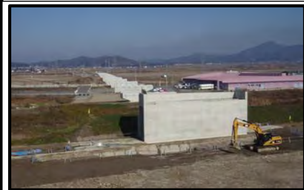
西郷高架橋(仮称)(新庄方向)