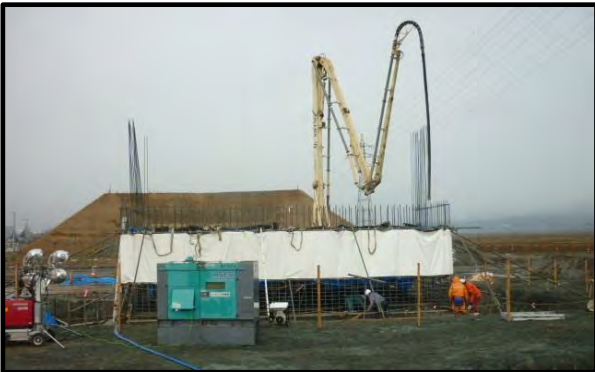
西郷地区(新庄方向)