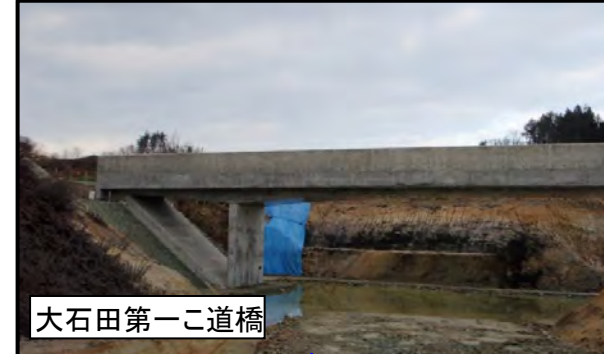
大石田第一こ道橋