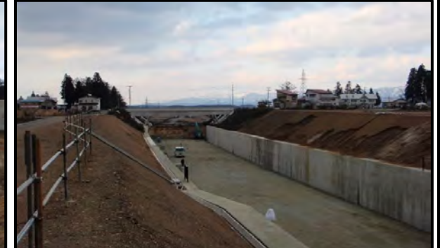
尾花沢地区(新庄方向)