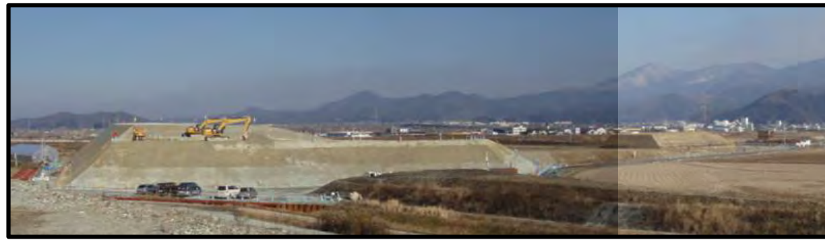
村山IC(仮称)(新庄方向)