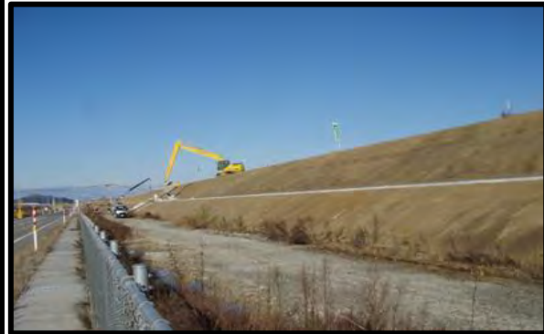
野田地区(新庄方向)