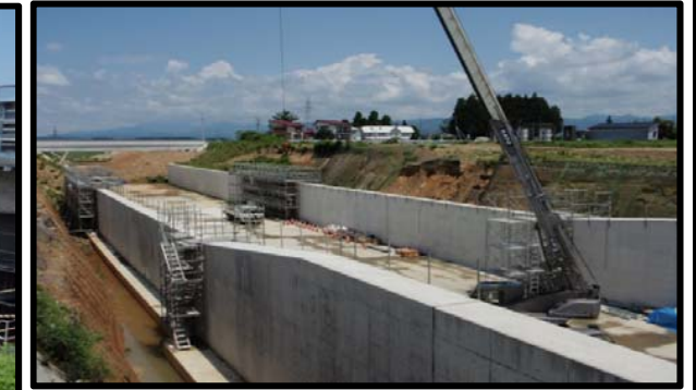
尾花沢地区(新庄方向)