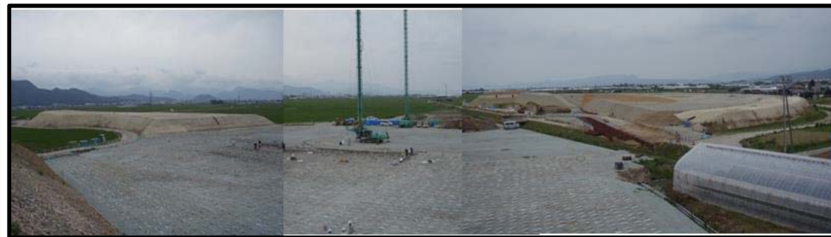
村山IC(仮称)(山形方向)