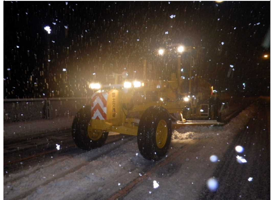
除雪作業の写真等

自分が担当している路線が、除雪がうまいと言われるように頑張ります。昼夜関係なく大変な作業ですが、地域の人達に喜んでいただけるように作業したいと思います。