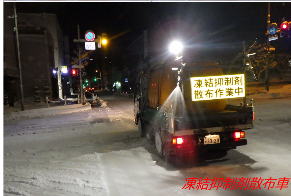
凍結抑制剤散布車