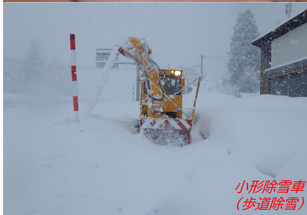
小形除雪車 (歩道除雪)