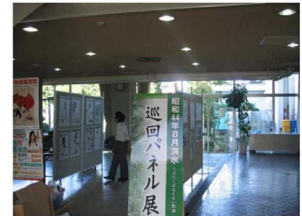
中山町 中央公民館

■被害は庄内、最上地方を中心に32市町村に及び、死者2人、負傷者8人を始め、家屋の全壊・流失13戸、半壊・床上浸水1,091戸、床下浸水3,834戸と甚大なもので、被害総額は約85億円(当時の額)に達しました。