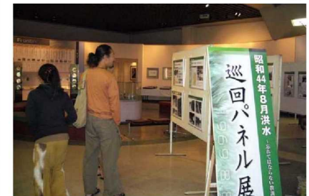
寒河江市 道の駅寒河江