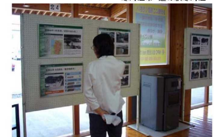
河北町 どんがホール