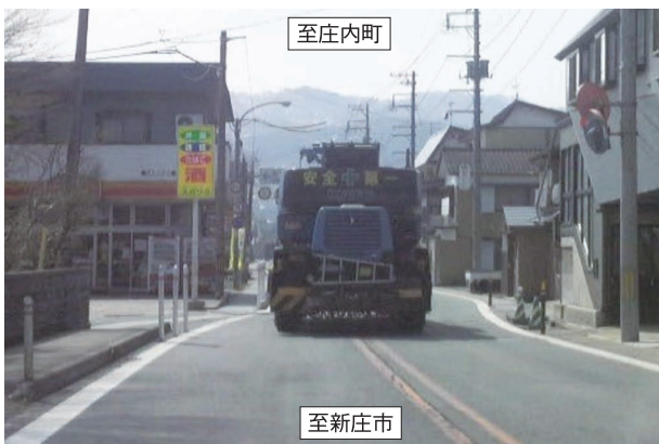
国道47号古口地区の大型車通行の状況