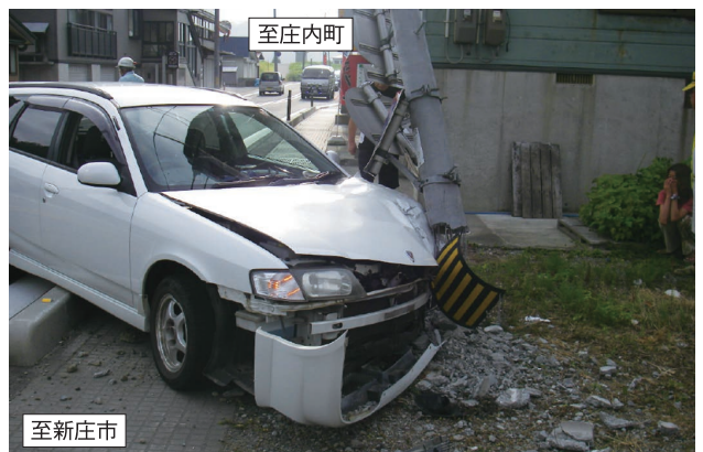
国道47号古口地区の事故発生の状況