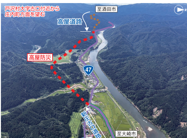
事業区間周辺(航空写真)