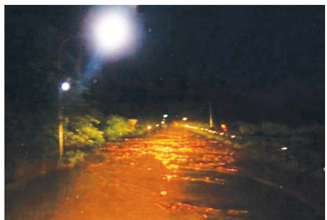
国道47号 戸沢村高屋地区の被災状況(土砂流出)(H30.8.6)