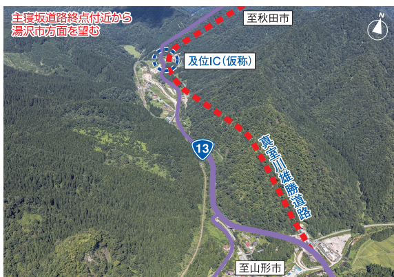
事業区間周辺(航空写真)