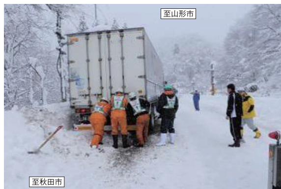
国道13号 大型車の立ち往生による通行止め(秋田県側)(H24.12.11)

*法面やトンネル出入口に雪が溜まり、道路に落下する危険があるため、定期的に取り除く作業