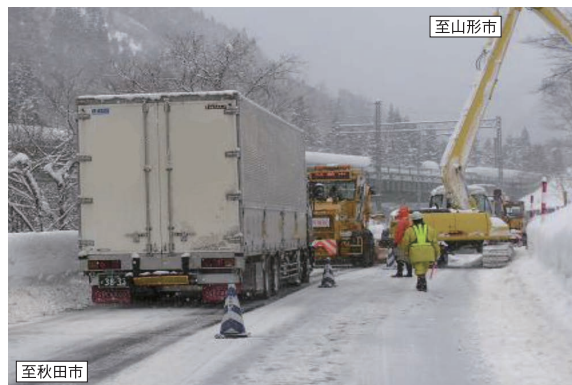
国道13号 通行規制を伴う雪崩・落雪予防*作業(秋田県側)(H22.2.10)

*法面やトンネル出入口に雪が溜まり、道路に落下する危険があるため、定期的に取り除く作業