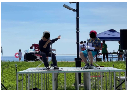
ステージ講話(野鳥)