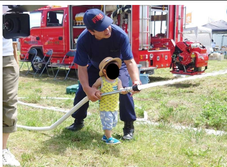
消防車で放水体験コーナー