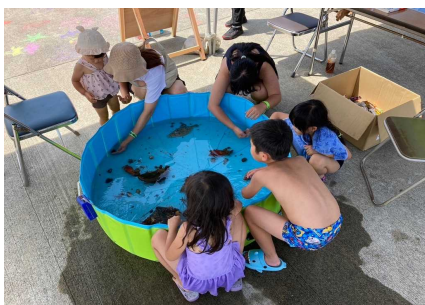
海の生き物をさわってみようコーナー