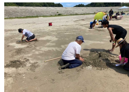
スナガニ掘り体験