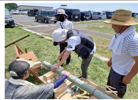
竹でコップ作り体験コーナー