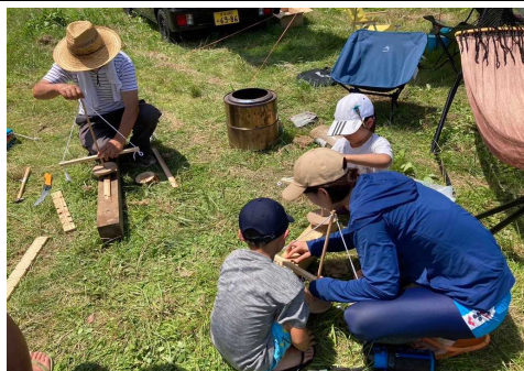
火おこし体験コーナー