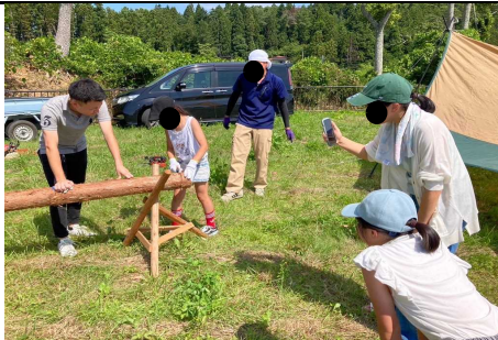
丸太を切ってみようコーナー