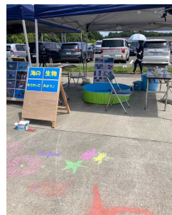
防潮堤チョークアート体験コーナー