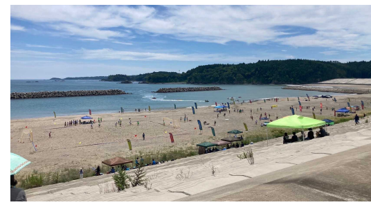
ビーチスポーツ体験コーナー