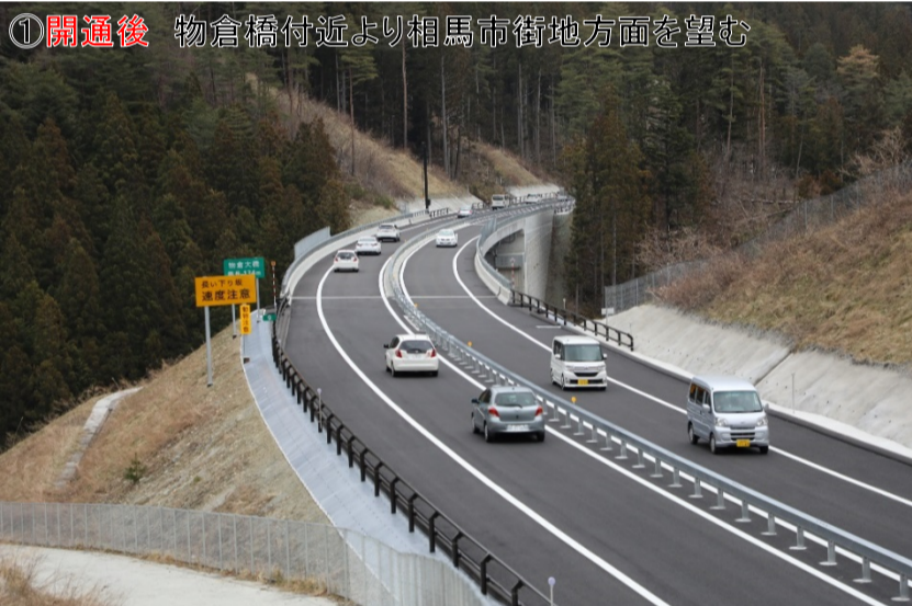
①開通後 物倉橋付近より相馬市街地方面を望む