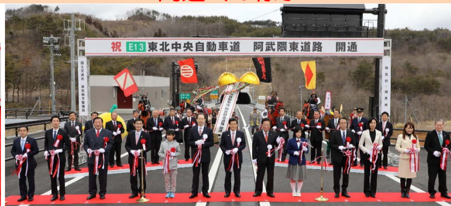
テープカット、くす玉開き