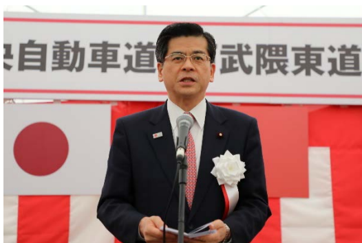
石井国土交通大臣挨拶