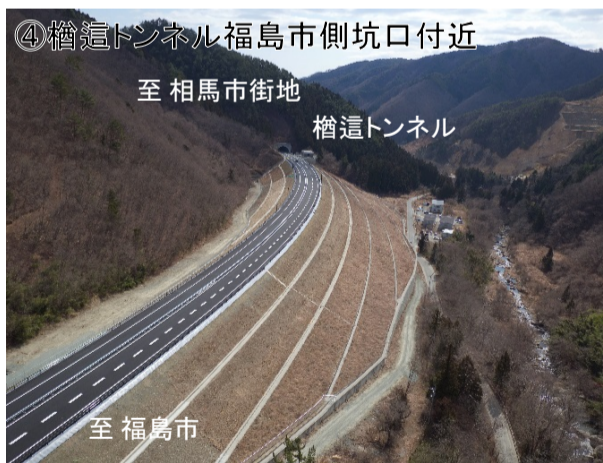
④櫛這トンネル福島市側坑口付近 至 相馬市街地 櫛這トンネル 至 福島市