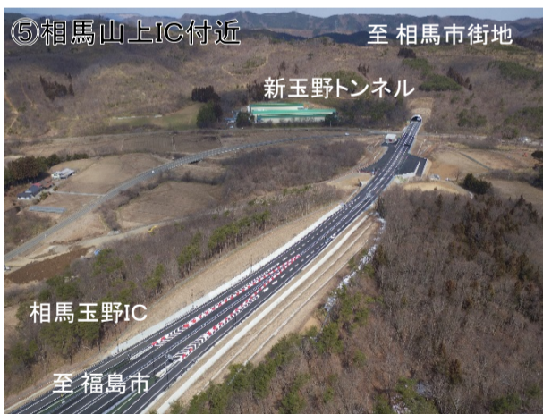
⑤相馬山上IC付近 至 相馬市街地 新玉野トンネル 相馬玉野IC 至 福島市