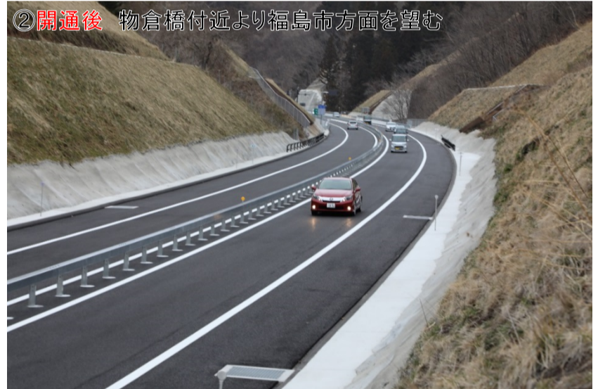
②開通後 物倉橋付近より福島市方面を望む