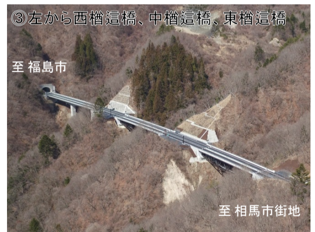
③左から西櫛這橋、中櫛這橋、東櫛這橋 至 福島市 至 相馬市街地