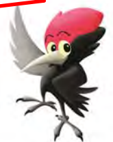
津軽ダムイメージキャラクター ハッカー君